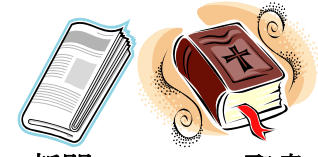
新聞 NEWSPAPER 聖書 BIBLE