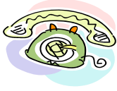
電話をかけたい TO MAKE A PHONE CALL