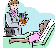
面会者お断り NO VISITORS PLEASE