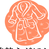
着替えがほしい CHANGE OF CLOTHES